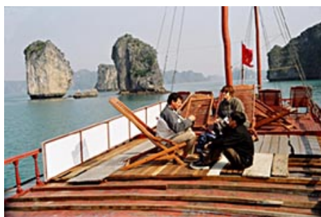
Notre bateau avec le Sinh Café

Nous taïrons les difficultés que nous avons eues à retrouver notre guide à CAT BA mais finalement, après une nuit très très froide ( sans draps mais 3 couvertures !!!!) dans un petit hôtel de l'île (5 USD la nuit, sans petit déj'), nous retrouvons le groupe et partons enfin en bateau à HALONG CITY et là, c'est la récompense suprême : 3 heures de balade sur la Baie d'Halong et par beau temps !